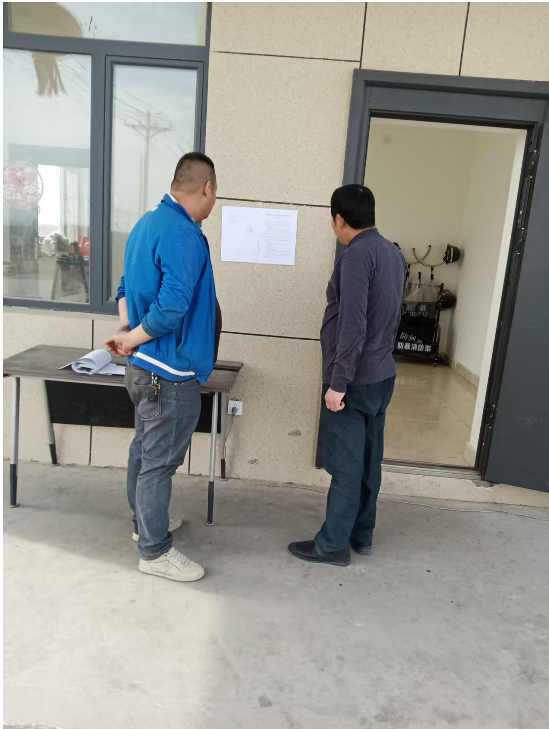
图3-4 第二次公示（项目区张贴公示）